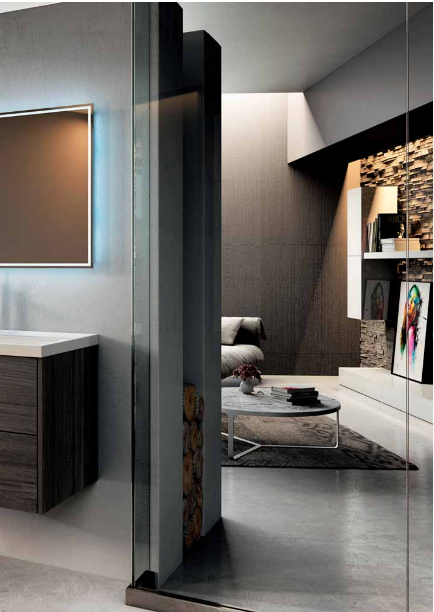
CALIPSO 120 - olmo onyx