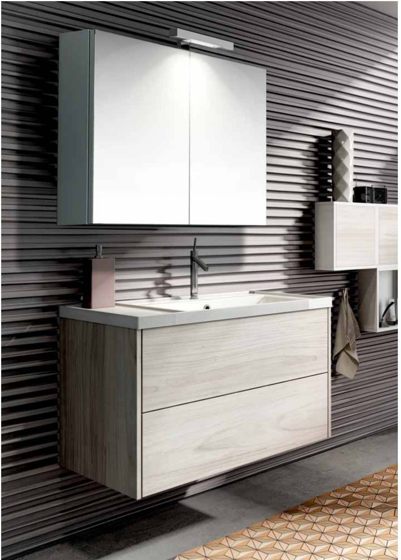
CALIPSO 90 - olmo creme