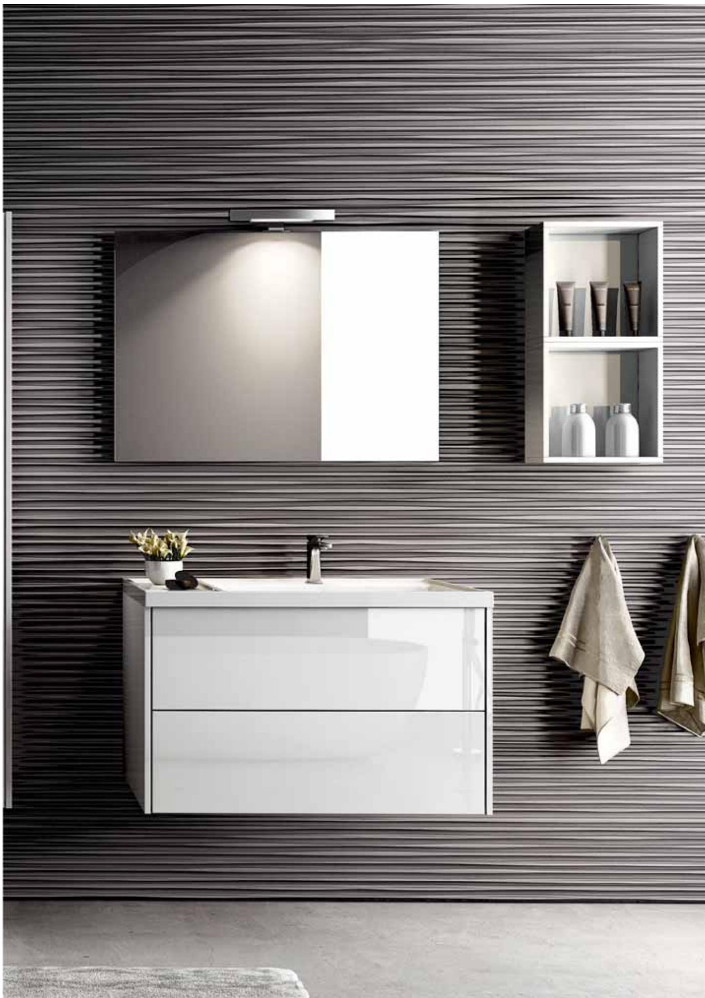
CALIPSO 90 - bianco lucido